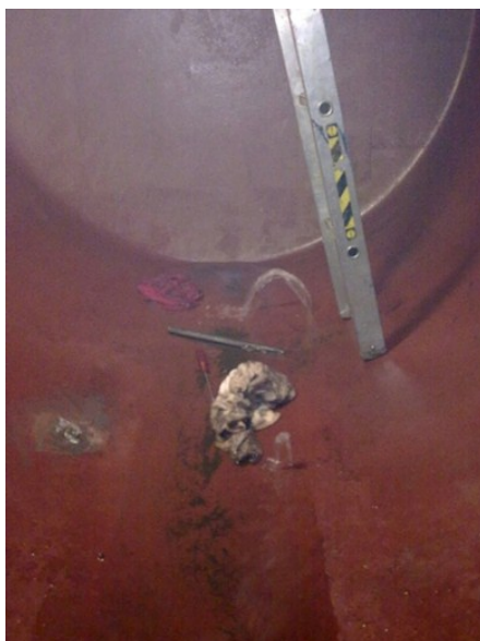
korrodierter Tank (Wassereintritt)

Ungeschützte Stahltanks werden im Laufe der Zeit durch die sogenannte Sumpfphase – ein Gemisch aus Schwitzwasser, Kondenswasser und Alterungsrückständen des Heizöls – von inneren elektrochemischen Korrosionen befallen. Die Folge: Der Tank wird undicht. Die Kunststoff-Innenhülle ist wie eine zweite Tankwand und verhindert zuverlässig die Berührung der aggressiven Sumpfphase mit dem Tankboden. Vor dem Einbau wird der Tank gründlich gereinigt. So kann auch eine fortgeschrittene Korrosion dauerhaft gestoppt werden und der Tank ist wieder sicher.